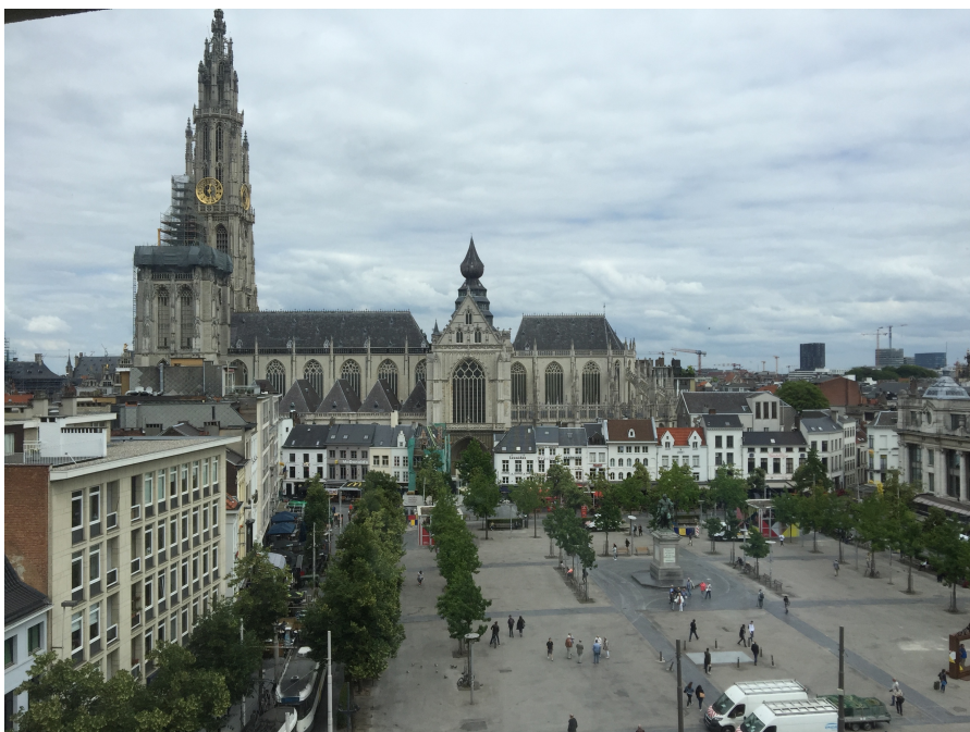
Aussicht aus der Karel de Grote