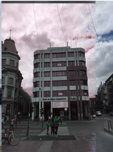
Frontansicht der KdG